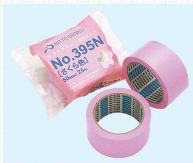
養生用テープ (さくら) テープ中に、ハロゲン・硫黄・鉛などの重金属を含む原材料は使用しておりません。