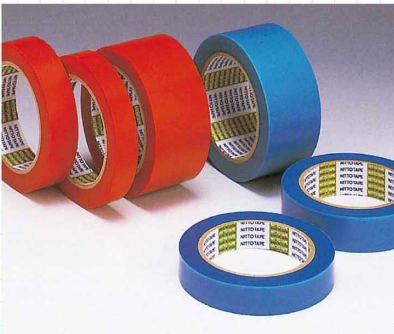
ホールディングテープ PETを基材に使用した仮止め用のテープです。電気製品・事務機器などの部品押さえ、仮止め用途におすすめです。