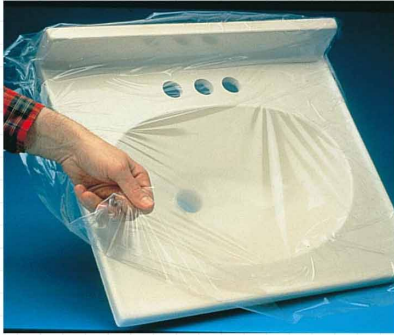
表面保護テープ (建材など) 3MのAシリーズは多層オレフィンフィルム基材を使用した強度のある新しい表面保護テープです。