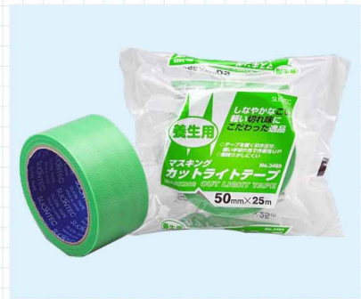
布養生テープ 建築現場などの養生に使用されるテープです。接着性ももとより、剥がした時の糊残りもこのテープにとっては、重要なファクターです。