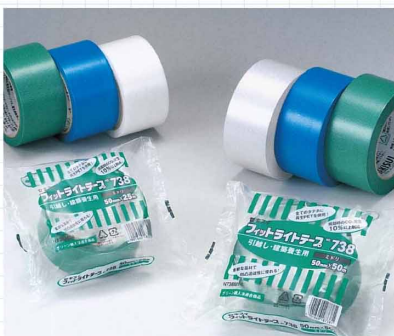
フィットライトテープ シートなどの仮止めに最適です。手で簡単に切れ、糊残りもありません。再生PET繊維を使用し、環境に配慮した、引越し、建築養生用テープです。