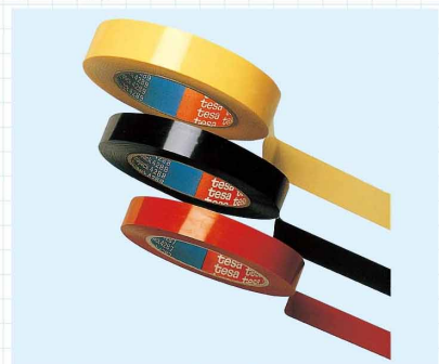
ストラッピングテープ PPを基材とした、糊残りがなく引張り強度に優れたテープです。部品の仮止め、パイプの類の結束にもおすすめです。