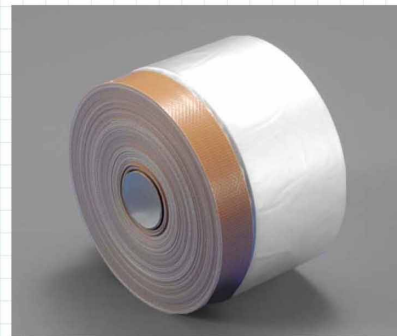
ロールマスキータープ 布テープや和紙テープをベースにフィルムを貼り合わせたテープで、塗装のマスキングに最適です。別注品も承ります。