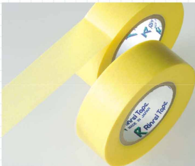
和紙マスキングテープ 薄くしなやかなこのテープは、微妙なカーブやシャープな直線に追従します。現代の塗装作業に必要な機能を集約したテープです。