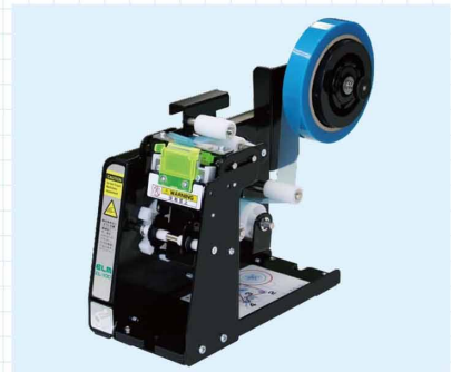
手動タブディスペンサー 手動で簡単にタブ付きテープが作れます。長さ調節機能付き。剥がしやすいテープが作れるので剥がす人の作業性が向上します。