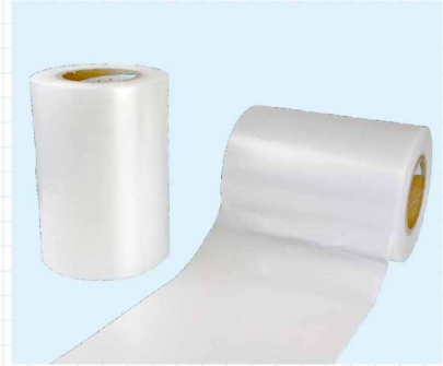
表面保護テープ (糊なし) 共押し出しの多層フィルムで、糊をコーティングしていないため、糊残りもなく、しかも安価です。