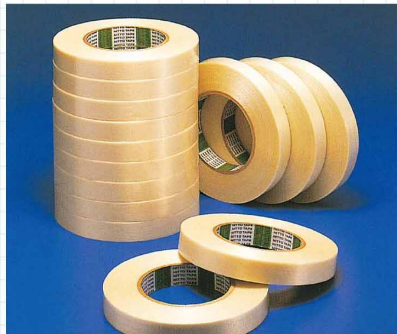
フィラメントテープ ガラス繊維がテープの縦方向に入っているテープです。パイプ類・重量物の結束用、家電品、家具類の部品抑え用におすすめです。