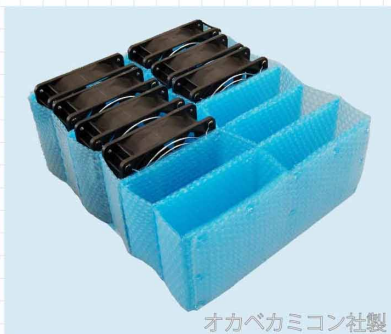
オカベカミコン社製

梱包物の空間埋めに最適です。ロール状でミシン目が入っており、適当な大ききで切れます。